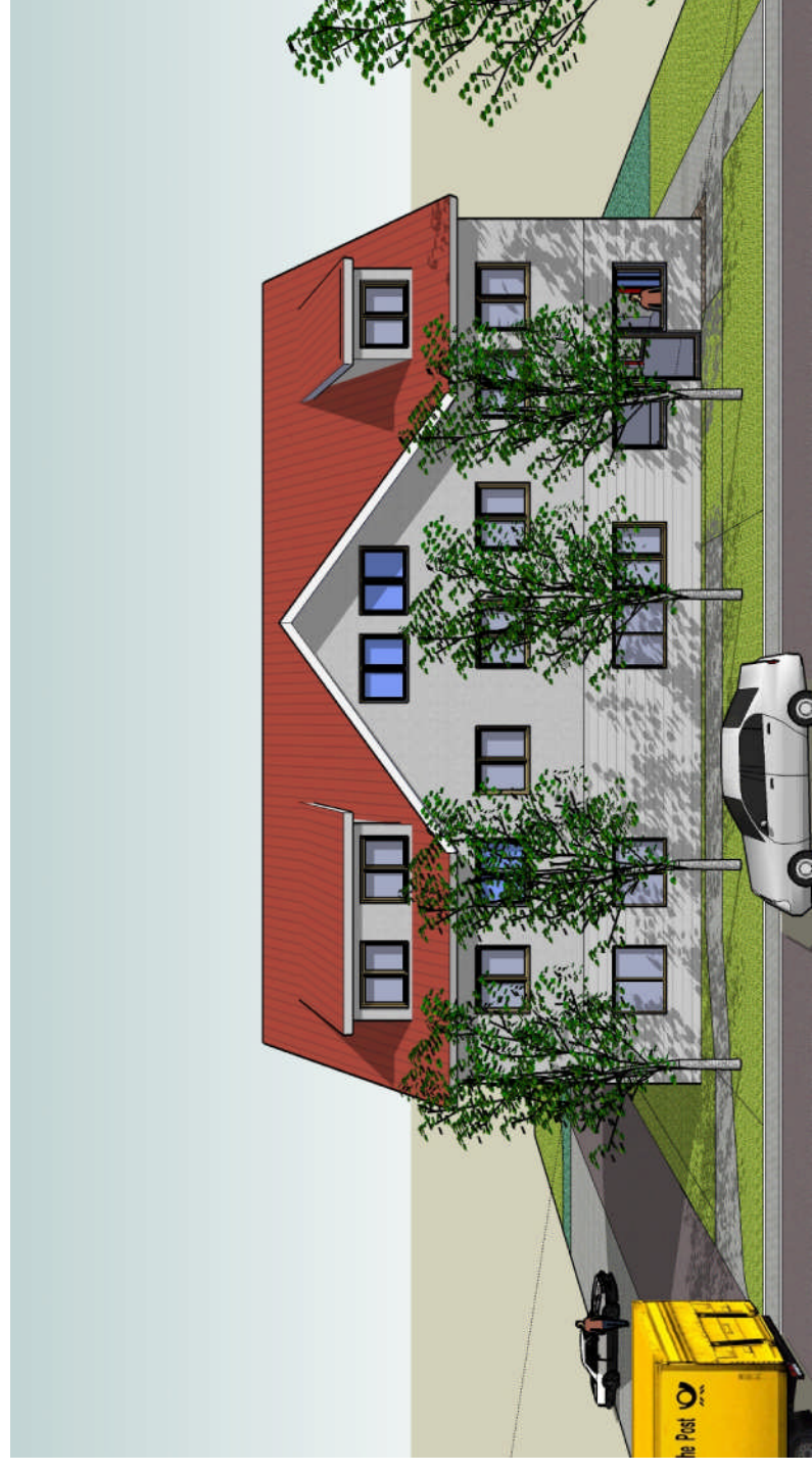
Ansicht Südseite (Straßenansicht)