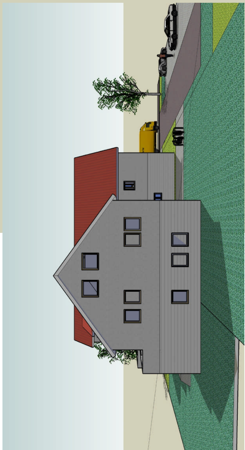
Ansicht Nordseite (Gartenseite)